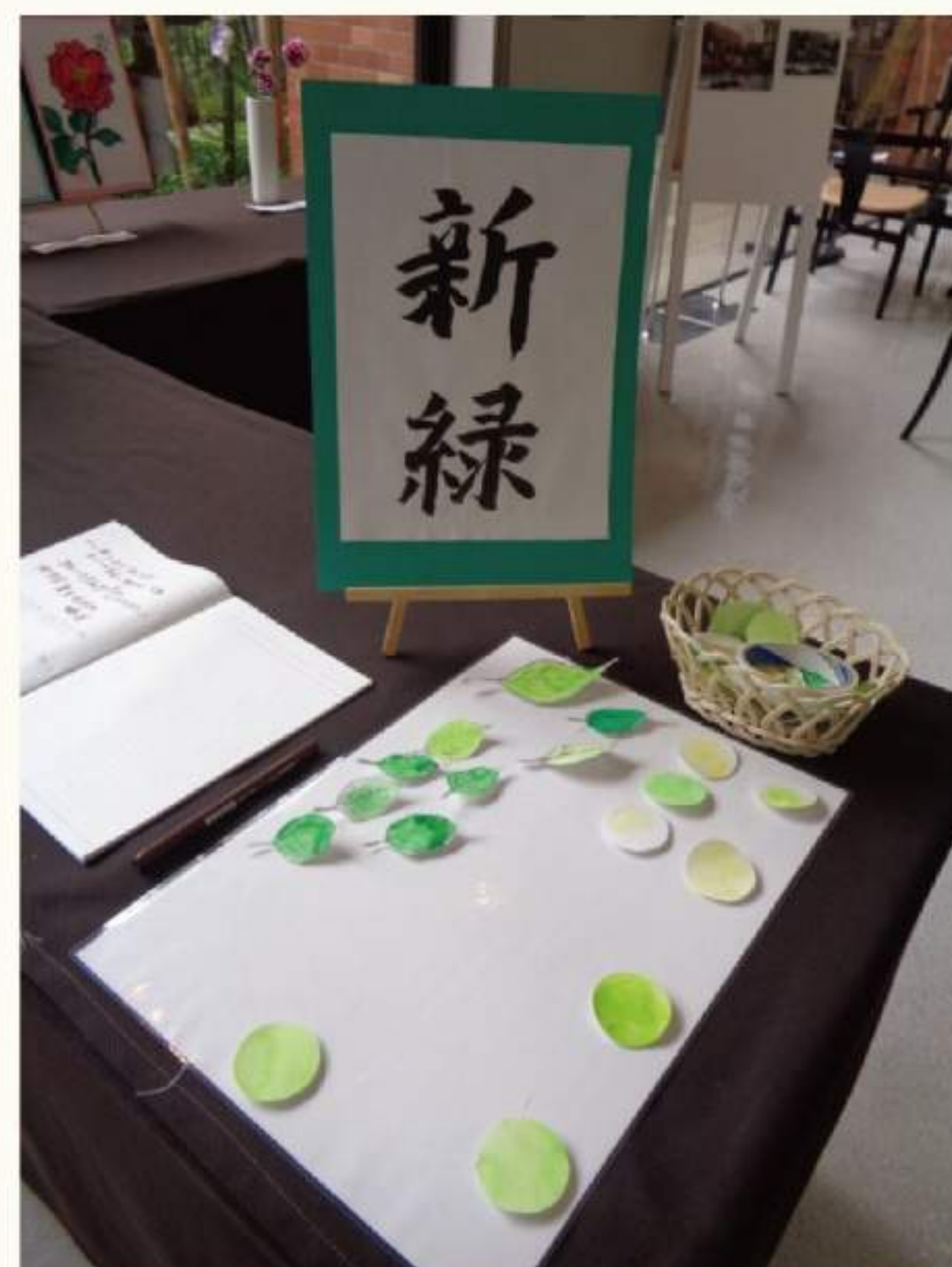
リハビリテーション部 レクリエーションセクション