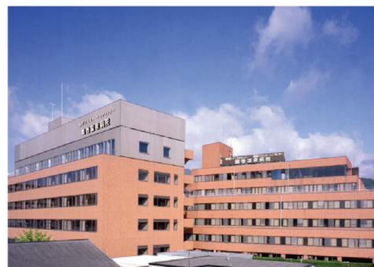
鶴巻温泉病院 全景